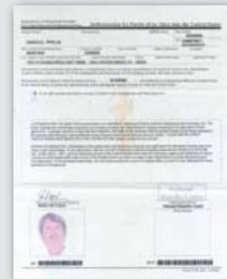
Permiso Provisional de Viaje (Parole Letter)