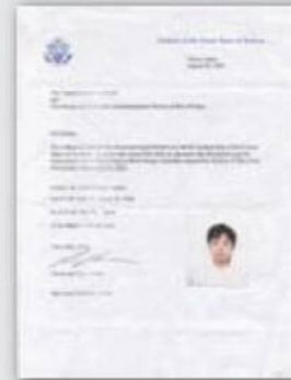
Carta de Transporte (Transportation Letter)