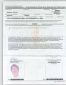
Permiso Provisional de Viaje (Parole Letter)