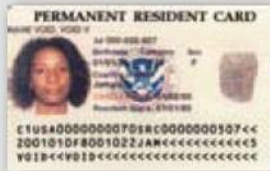
Tarjeta de Residente Permanente

Residentes Permanentes Legales requieren uno de los siguientes documentos para entrar a los Estados Unidos cuando su llegada es por aire