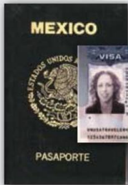
Pasaporte y Visa

Ciudadanos Mexicanos requieren los siguientes documentos cuando su llegada es por aire