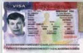
Visa de Inmigrante