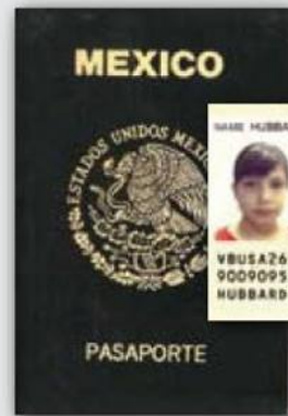
Pasaporte y Tarjeta de Cruce Fronterizo