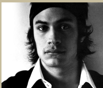
Gael García Bernal

Los organizadores del Festival de Cannes anunciaron también que el actor Gael García Bernal presidirá el jurado que concederá la Cámara de Oro, el galardón al mejor primer largometraje de dicho evento. Este premio fue creado en 1978 por el ex presidente del festival Gilles Jacob que reconoce a la mejor opera prima de todas las secciones del festival más prestigioso del mundo. El reconocimiento que concederá dicho jurado independiente será entregado durante la ceremonia de clausura del festival, que tendrá lugar el 24 de mayo próximo.