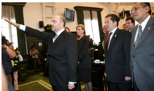
El pasado 8 de abril, el H. Senado de la República ratificó el nombramiento del Embajador Carlos de Icaza González como Representante Permanente de México ante la Organización de las Naciones Unidas para la Educación, la Ciencia y la Cultura (UNESCO)

El pueblo de México confiere a los objetos producto de culturas antiguamente establecidas en su actual territorio nacional. Por ello, es política firme del gobierno mexicano adoptar medidas tendentes a recuperarlos cuando son ubicados en el extranjero y existen indicios de que fueron sustraídos indebidamente del territorio nacional.