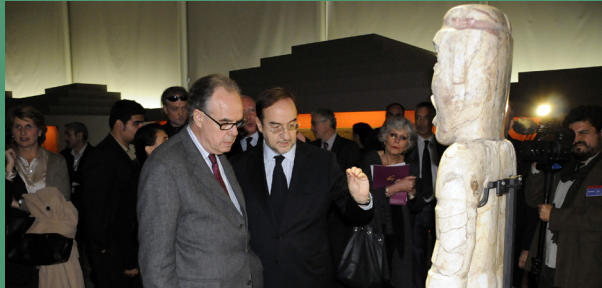
Le ministre français de la Culture, Frédéric Mitterrand, a visité l'exposition Teotihuacán, Cité des Dieux

La magie et le mystère qui entourent une des plus grandes cités de l'Ancien Mexique ont suscité beaucoup d'intérêt chez le public français. La presse a pour sa part grandement fait l'éloge de l'exposition «Teotihuacán, Cité des Dieux», qui se tiendra jusqu'au mois de janvier 2010 au musée du quai Branly, laquelle est le fruit de l'excellente coopération culturelle qui existe entre la France et le Mexique.